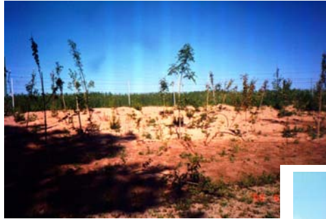
KH-06 + sand-täckning, juni 1998