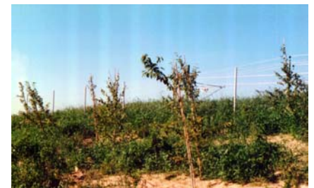
Enbart sand-täckning, juni 1998

Patrik Ahlqvist, arbetsledare hos Vägverket Produktion, Göteborg ” - Skillnaden mellan KH-06 + sand och ytor med enbart sand är uppenbar och tydlig, vilket för oss som entreprenör minimerat behov av normal ogrärensning i KH-06-ytan under försommaren. Således minskar kostnader för ogrärensning vid plantor och ytan i allmänhet, som alltid måste ske, och därmed våra totala skötselkostnader under garantitiden.”