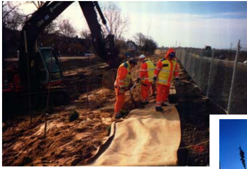
Utläggning, april 1998