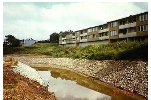
Detta är den traditionella lösningen