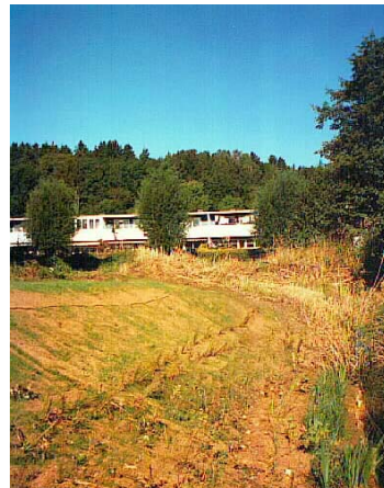
.....3 veckor senare