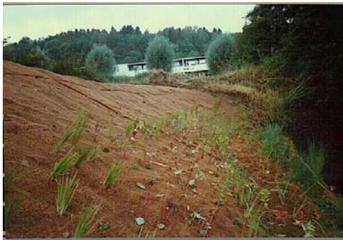
Efter färdigställt arbete