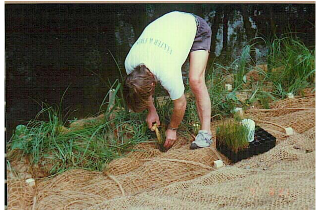
Plantering av pluggplantor