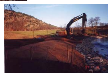
Utläggning av erosionsmatta