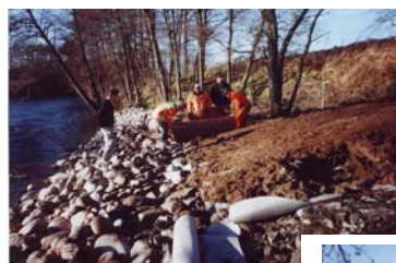
Vegetationsskikt på bank