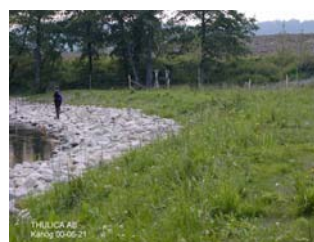
Väletablerad Juni 2000

För information, kontakta oss per brev, E-mail telefon eller telefax eller se vår hemsida www.thulica.com .