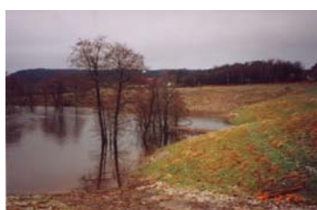
Extremt vattenstånd December 1999